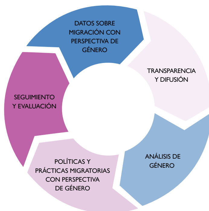
Figura 3. El ciclo de elaboración de políticas migratorias empíricas con perspectiva de género

La inclusión explícita y el uso de datos sobre el género para respaldar todas las etapas del ciclo normativo mejora aún más la perspectiva de género. El concepto básico de la perspectiva de género es que las políticas en todos los niveles y etapas del ciclo normativo (Figura 3) deben garantizar la protección de los derechos humanos de todos a través del reconocimiento y la respuesta a las necesidades y desafíos específicos de aquellos que a menudo son marginados y se encuentran en situaciones de vulnerabilidad, incluidas las mujeres, las niñas y aquellos con identidades de género diversas.