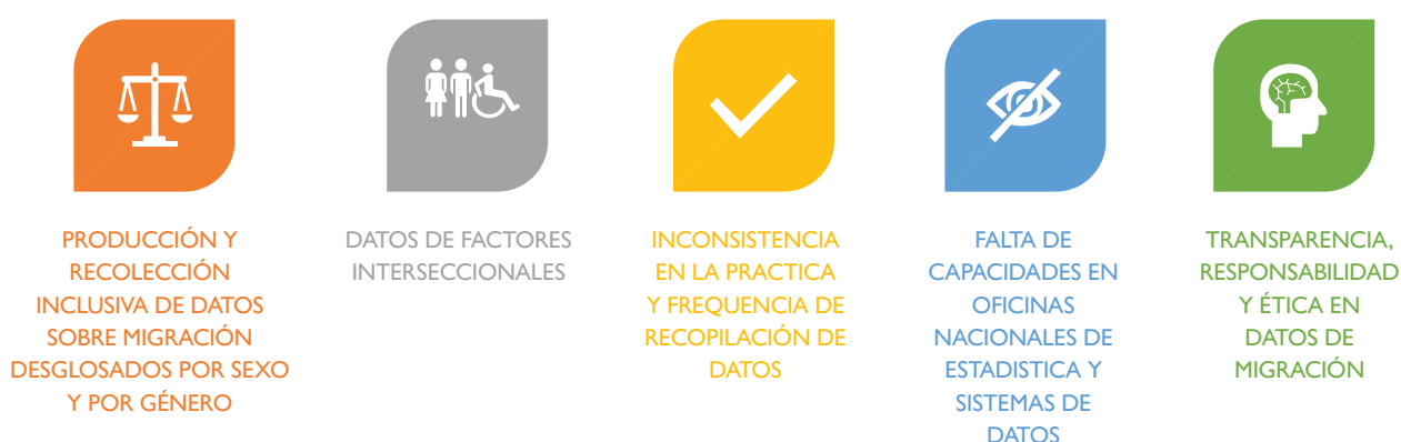
Figura 1. Las cinco principales brechas y desafíos de género en los datos sobre migración

La falta de datos dificulta la consecución del objetivo de la Agenda 2030 de no dejar a nadie atrás. Las mujeres migrantes representan casi la mitad (48 %) de los migrantes internacionales en todo el mundo (DAES, 2021), y la falta de datos tiene consecuencias para la gobernanza migratoria mundial, así como para las propias mujeres migrantes. Por ejemplo, la falta de datos sobre género y migración dificulta la capacidad de los gobiernos para estimar las contribuciones de las mujeres migrantes a las economías de los países de origen y destino, a través de sus remesas sociales y económicas (ONU-Mujeres, 2017), y también en términos de su contribución a la economía a través de su trabajo de prestación de cuidados remunerado y no remunerado. Los datos sobre refugiados y solicitantes de asilo presentan brechas en relación con la identidad de género de los refugiados, así como con las razones de género para solicitar asilo (por ejemplo, la violencia de género [VG]). Los datos desglosados por sexo y género son necesarios no solo para proteger los derechos, prevenir la explotación y fundamentar las políticas, sino también para maximizar los beneficios económicos y sociales de la migración.