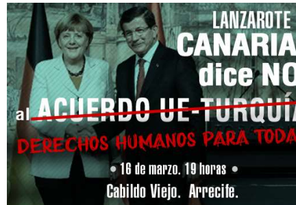
Organizadas y enredadas