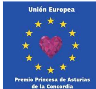
Lavado de cara a la UE