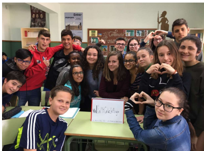
Campaña escolar #EnMiColeYoAcojo