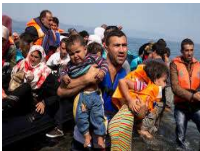
Rescates de balsas en Lesbos